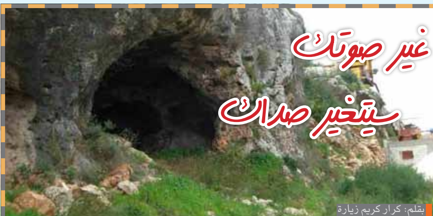
بقلم: كزار كريم زيارة

الشهر السرياني (التقويم الآرامي) تموز: اللفظ بابلي عن لفظ سومري يعني ابن الحياة وقصد به إله عبده السومريون والاكاديون، وكان هذا الشهر مكرسا له وهو إله يموت ويعود.